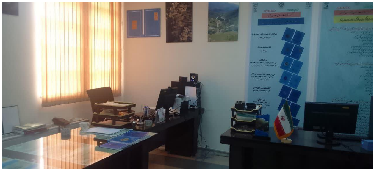
ماکت هورامان (اهدایی همایش "هورامان ثبت جهانی، فرهنگ و توسعه پایدار" به پژوهشکده مطالعات فرهنگی و اجتماعی غرب کشور(محل استقرار کتابخانه مرکزی و مرکز اطلاع‌رسانی)